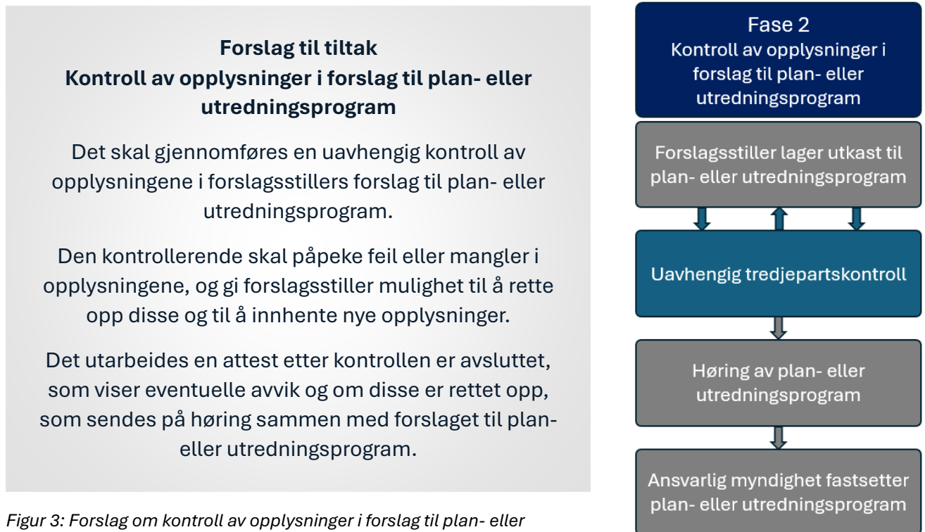
Figur 3: Forslag om kontroll av opplysninger i forslag til plan- eller utredningsprogram.

Det kan videre diskuteres om denne kontrollen skal gjelde generelt for alle typer konsekvensutredninger, eller om den skal forbeholdes tilfeller hvor behovet for uavhengig kontroll er størst. På den ene siden kan det argumenteres for at en slik kontroll alltid bør utføres for planer og tiltak som omfattes av KU-forskriften § 6. Samtidig gjør nok behovet for uavhengig kontroll seg mest gjeldende ved privatinitierte reguleringsplaner hvor kommunene er ansvarlig myndighet.