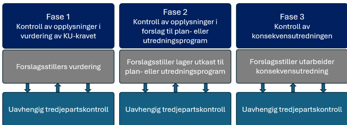
Figur 5: Uavhengig kontroll i tre faser i konsekvensutredningen (forenklet versjon av Figur 1).

Vi drøfter også kort faste kostnader (forskriftsendring og forvaltning). Vi gjør først og fremst kvalitative vurderinger, og vi viser til relevante eksempler på virkninger for å drøfte størrelsesorden.