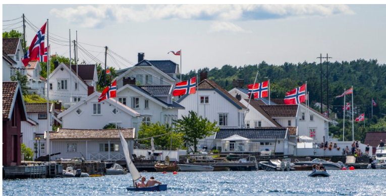
Strandsonevernet har vært et betent politisk og juridisk stridstema de siste ti årene.

Kursets tredje dag vil ta for seg byggesaksbehandling. Vi ser på koblingene mellom plandelen og byggesaksdelen i loven. Overgangen fra plandelen til byggesaksdelen byr på, rettslig sett, skifte av kommunenes rolle og ansvar, og skillet mellom juss og politikk trer klarere frem. Vi tar for oss kravene til byggesøknader og til kommunens søknadsbehandling, og byggesaksdelens prinsipielle utgangspunkt "byggeretten" ses opp mot kommunens handlingsrom til å styre og stanse tiltak. Denne dagen tar også for seg ulovlighetsoppfølging, fra vurderingen av om det foreligger en ulovlighet som skal følges opp, til virkemidlene kommunene har til rådighet når de følger opp ulovligheter.